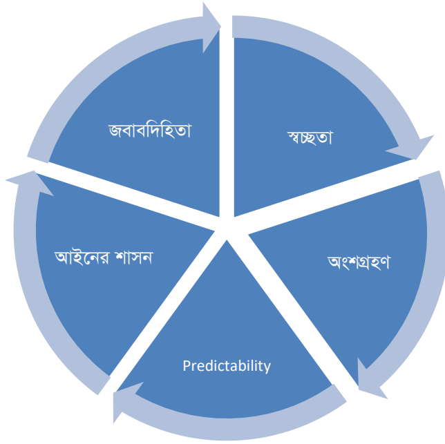
চিত্র ০১: সুশাসনের উপাদান (সূত্র, Rahman, 2014)।

সুশাসন শাসনের এমন একটি গুণ যার মাধ্যমে এমন কিছু বিষয়াবলি যেমন একটি রাষ্ট্রের সার্বিক কর্মকাণ্ডে জবাবদিহিতা, স্বচ্ছতা, কার্যকর, ক্ষমতায়ন, অংশগ্রহণ, টেকসই, নিরপেক্ষতা, এবং ন্যায়বিচার ইত্যাদি বিষয়কে অন্তর্ভুক্ত করে। শাসন পূর্বসংকেত (Predictability) বলতে আইন এবং নীতির স্বচ্ছতা এবং নিরবিচ্ছিন্নভাবে সমাজে প্রয়োগ হওয়ার পাশাপাশি এ ব্যবস্থায় রাষ্ট্র এবং এর অঙ্গ প্রতিষ্ঠানগুলো আইনের কাছে বাধ্য থাকবে (Rahman, 2014)।